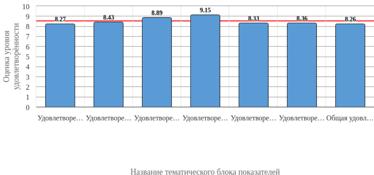
Рисунок 3.1 - Средняя оценка удовлетворенности (по всем тематическим блокам показателей)

Средняя оценка удовлетворенности респондентов по блоку вопросов «Удовлетворенность организацией обучения» равна 8.27, что является показателем высокого уровня удовлетворенности (75-100%).